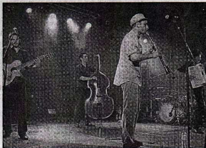
Le Syndrome du Chat a assuré l'ambiance le samedi soir.

Le public a eu du mal à quitter le festival le dimanche soir, reprenant en chœur les morceaux joués par la joyeuse fanfare licinienne La Banda Bruity. « Nous sommes tous simplement ravis, vivement la prochaine édition ! » concluent les organisateurs. Rendez-vous dans deux ans, cette fois-ci, espère-t-on, avec le soleil.