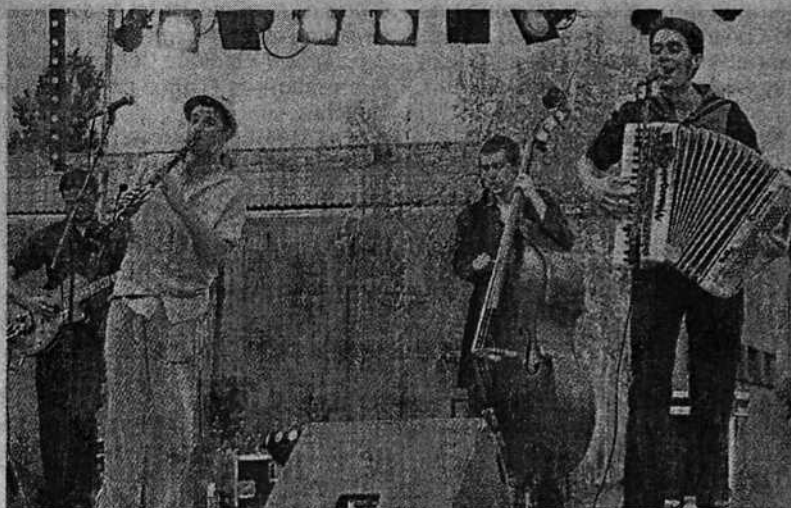
Les musiciens du Syndrome du chat ont ouvert la soirée musicale de samedi.

Le week-end jeunesse, samedi et dimanche, a de nouveau rassemblé des centaines de visiteurs au parc des sports. Outre les stands habituels, quelques temps forts sont à relever : l'installation d'une yourte, les ateliers de Passions et créations, ou encore les randonnées motos, goût et rollers qui ont rassemblé respectivement 85, 190 et 15 adeptes. Des randonnées conclues par un grand pique-nique, sur la prairie, animé par le groupe Bellini swing.