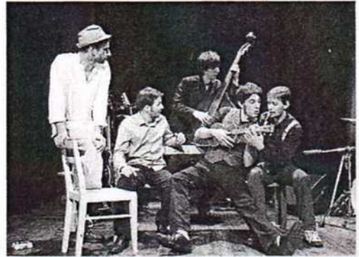
Le Syndrome du Chat, l'un des groupes locaux qui se produira au festival Terre de Zik, samedi 19 septembre.

La journée du 20 septembre sera animée par des troupes d'arts de rue que sont Quintette de Twin et Pas d'Nom